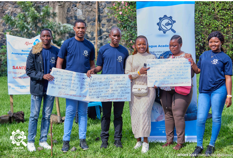
amani 2024 ©Benediction Murhabazi